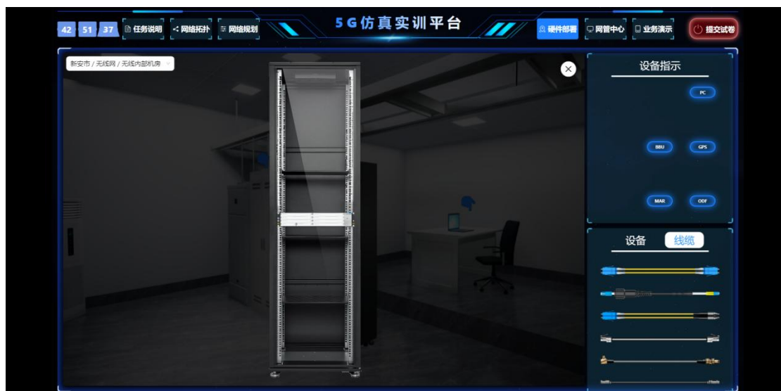
(3) ODF 架内部自带设备图